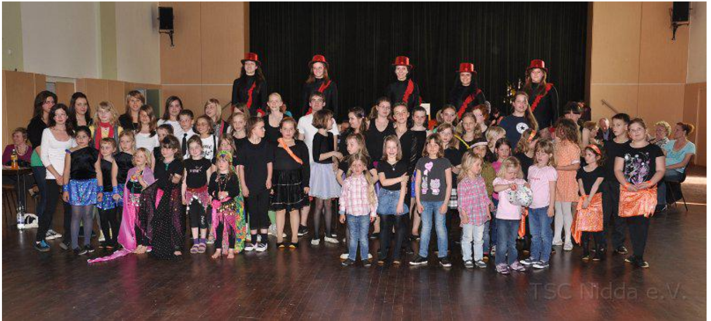
oben: (fast) alle Mitwirkende unten Videoclip und JOLI