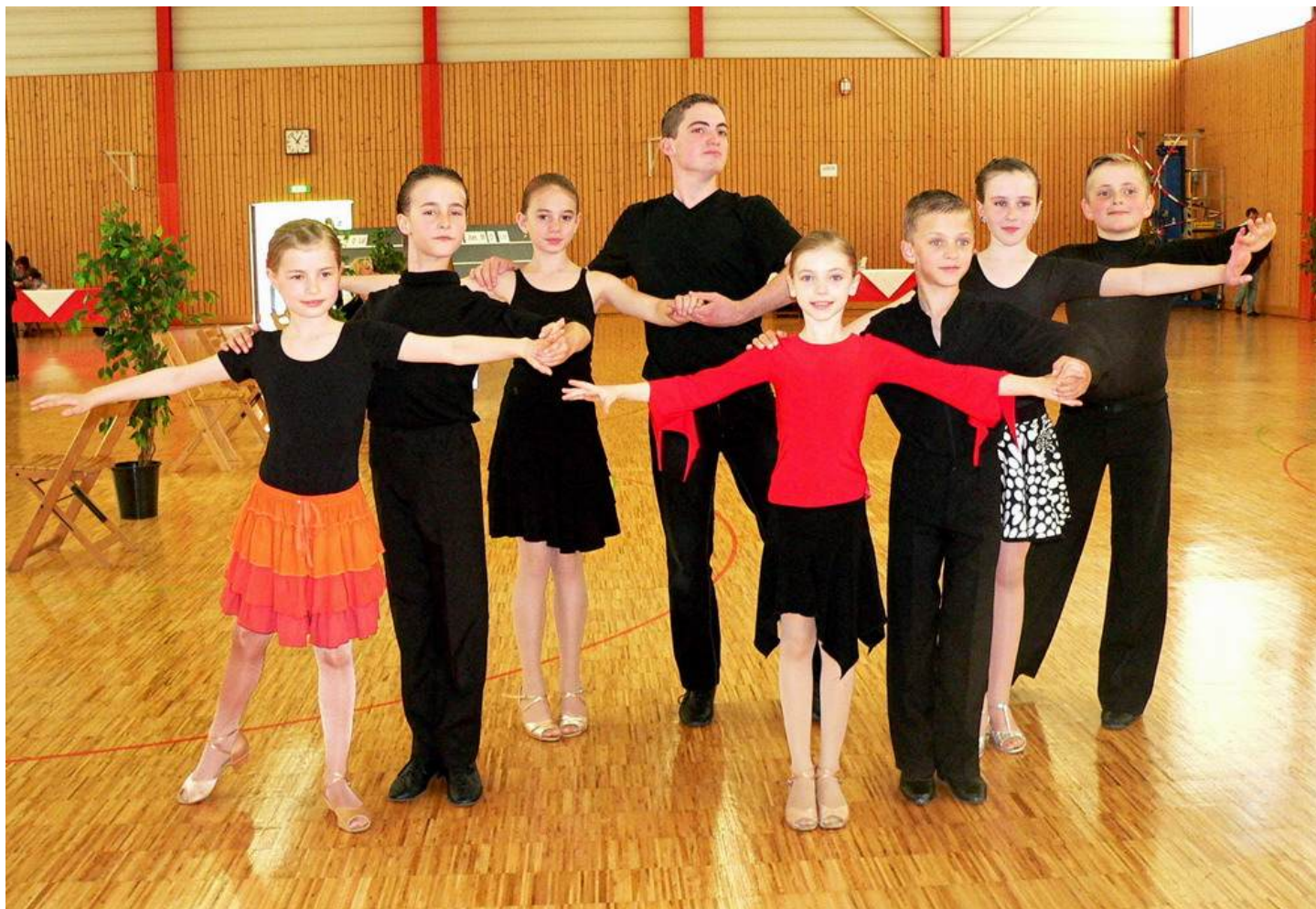
Kinder- und Jugendturnierpaare des TSC Schwarz-Gelb Nidda

Der Einladung zu diesem Turnier waren über 7000 Tänzer und Tänzerinnen aus der gesamten Bundesrepublik und dem benachbarten Ausland gefolgt. Der TSC Schwarz-Gelb Nidda wurde in diesem Jahr durch fünf Turnierpaare in verschiedenen Startklassen vertreten.