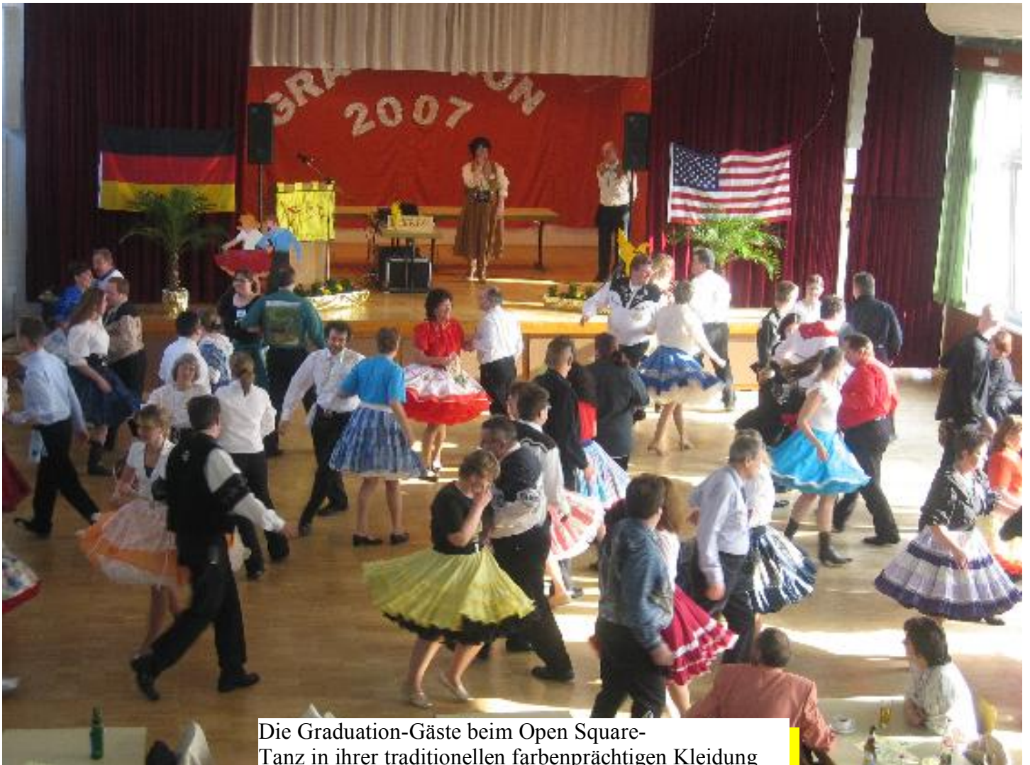
Die Graduation-Gäste beim Open Square-Tanz in ihrer traditionellen farbenprächtigen Kleidung

Die meisten haben das Schulalter lange hinter sich, doch Anspannung und Nervosität hatten sie gepackt wie seinerzeit zu den Klassenarbeiten: Die neun Square Dance Schüler der Birdy Dancers des TSC Schwarz-Gelb Nidda, die am Sonntag, dem 01. April, im Bürgerhaus Ober-Schmitten die Prüfungen zur Graduation ablegen sollten. Zu diesem feierlichen Ereignis waren nicht nur Familie und Freunde angereist, sondern auch 86 Tänzer aus 24 Clubs.